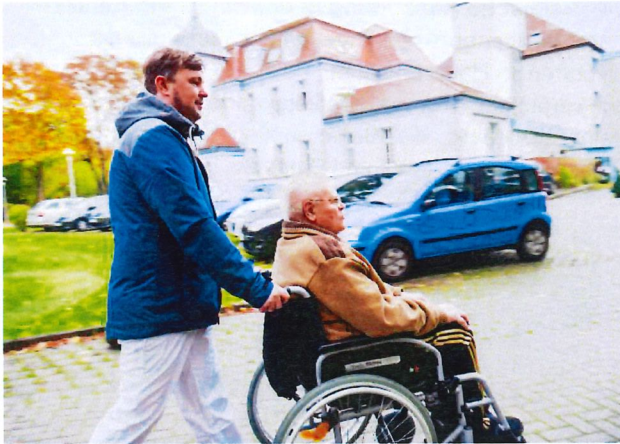
Bsp. Senioren- und Tagespflege

Und? Jetzt Lust mit uns die Zukunft der Pflege im Havelland zu gestalten?