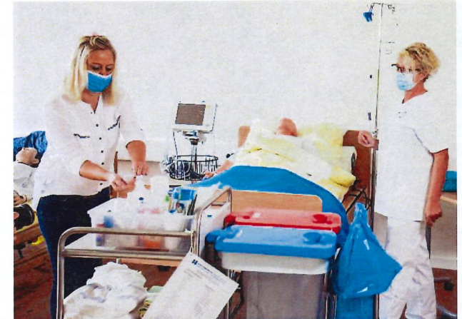
Bsp. Grundpflege und Krankenpflege