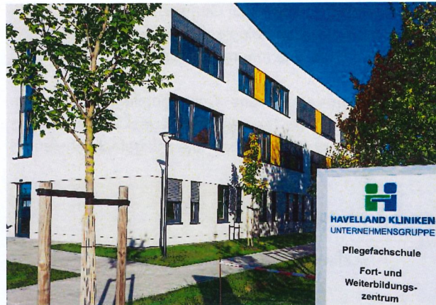
Pflegefachschule im Dreifelderweg 19 / 14641 Nauen

Der theoretische und praktische Unterricht findet an unserer neuen, modernen Pflegefachschule in Nauen statt. Der schulinterne Lehrplan umfasst 2.100 Stunden.